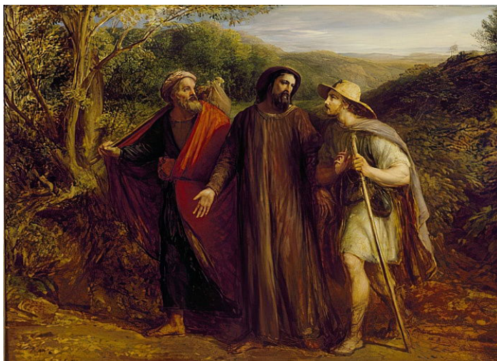
"L'apparition du Christ aux deux disciples d'Emmaüs" Cheminier de John Linnell (1792-1882, Royaume-Uni)